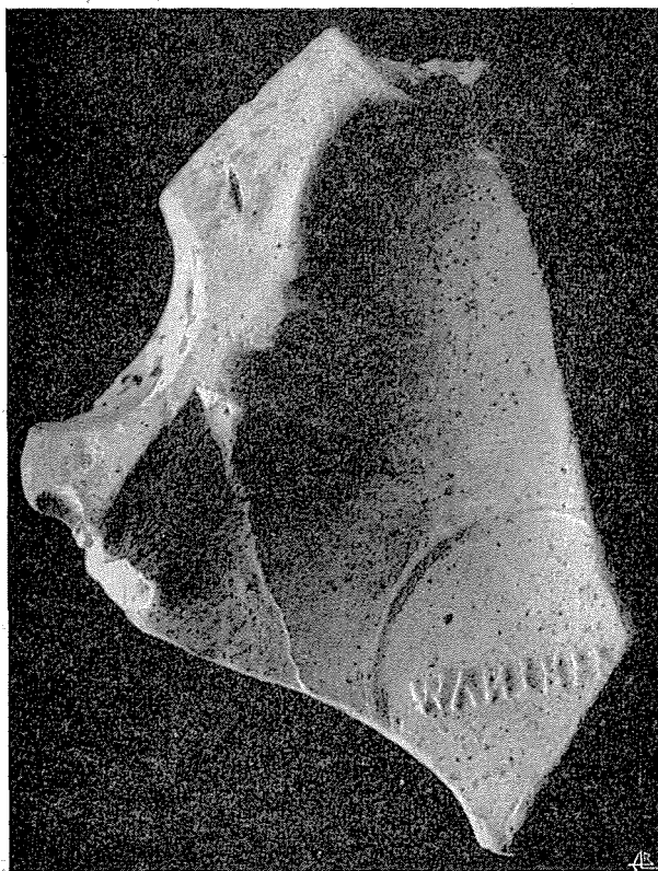
Fig. 2 — Molde de lucerna face interna

Em 1955 foi encontrada em Braga, pelo Reverendo Senhor Cónego Arlindo Ribeiro da Cunha, a parte inferior do molde duma lucerna que este ilustre investigador teve a gentileza de nos ceder para estudo (4).